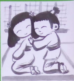
Le samourai se chauffe au soleil