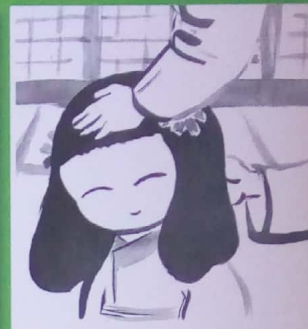
Le samourai se tient la tête haute