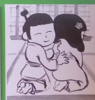
Le samourai a oublié son parapluie