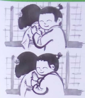
Le samourai, l'ours et le tigre se rencontrent