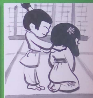
Le samourai pétrit le tigre