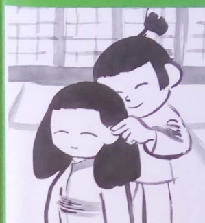
Le samourai dresse les oreilles