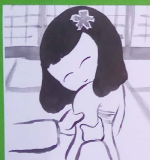
Le samourai s'agrippe comme un singe