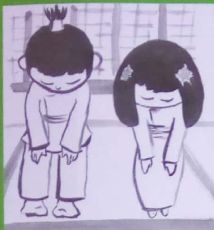
O genki desu ka?