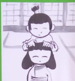
Le samourai sous la pluie