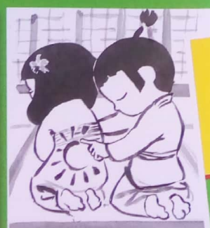
L'écusson sur l'armure du samourai