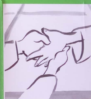
Le samourai se lave les mains