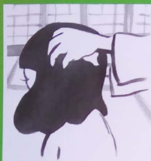
Le samourai se lave les cheveux